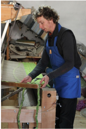
Am Webstuhl

entspannend und beruhigend auf die Herzfrequenz auswirken. www.reitebuch.de/zirbenkissen-zirbenbetten.html